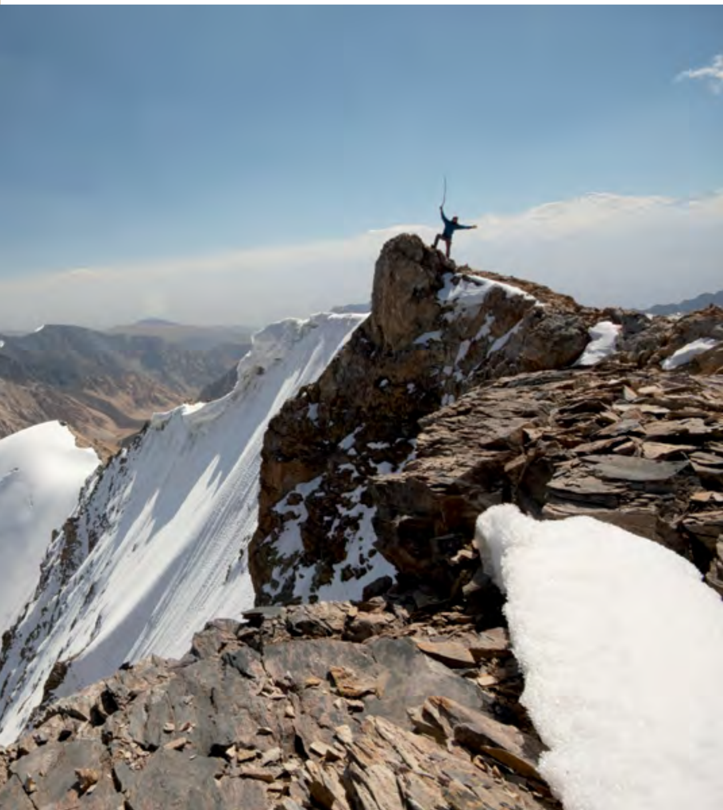
Na vrcholu Čon Kuntoru

Po krátkém rozdýchání a tyčince Big Shock jdeme dál. Z ledovce opatrně vylézáme na suťové pole a táhneme sebe, a hlavně batohy směrem nahoru. Těsně u vrcholu sedla je terén dost strmý, kameny pod nohama ujíždějí dolů. Posledních deset metrů prověří moje zkušenosti z rajbasů na volných střešních taškách. Nikča se přede mnou rychlým hrabáním dostává do sedla. Spoustu kamenů strhává na ledovec. Já se přes pár zbylých opatrně dostávám za ní.