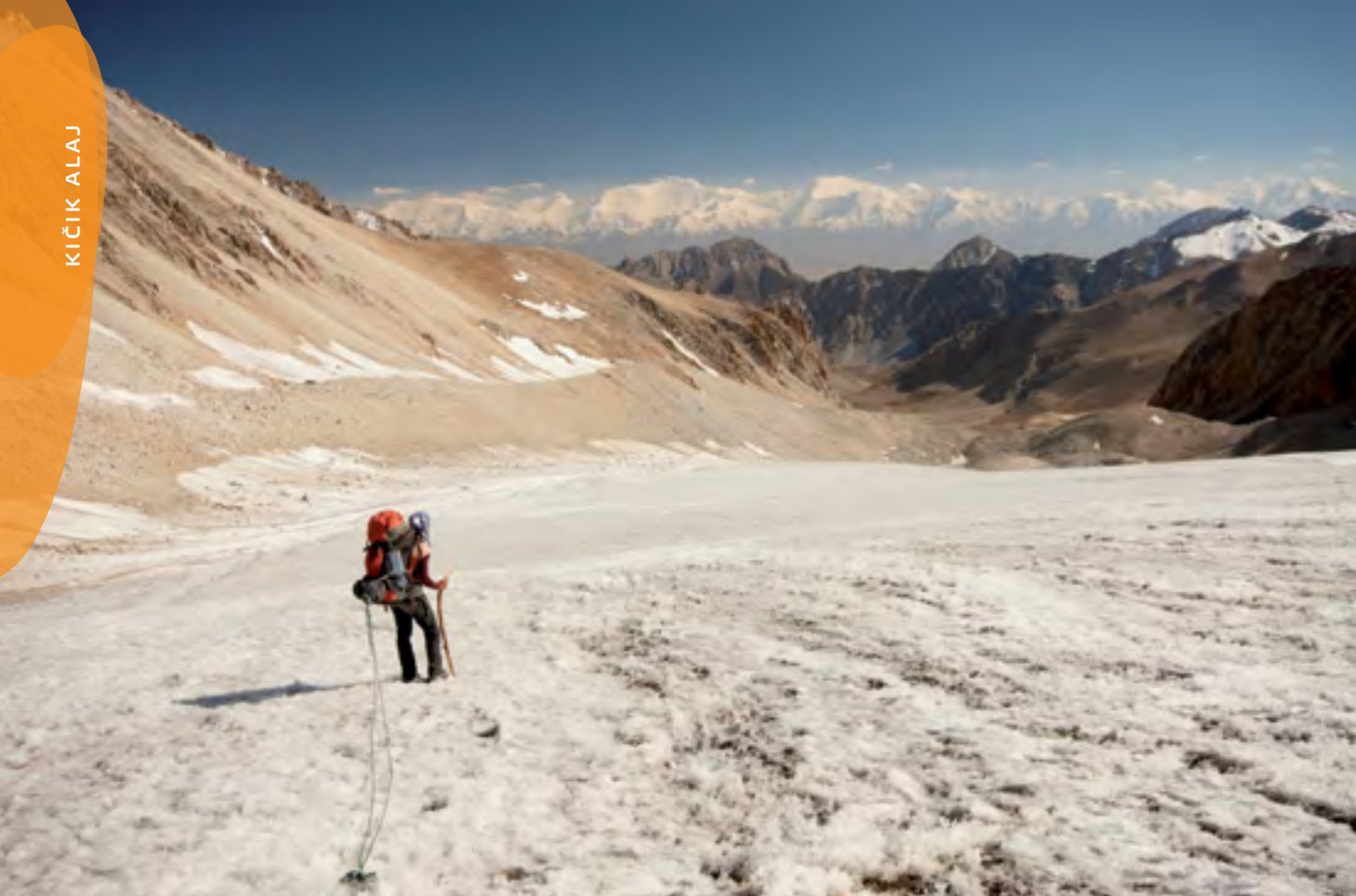
Jištění za batoh a Kozly v pozadí