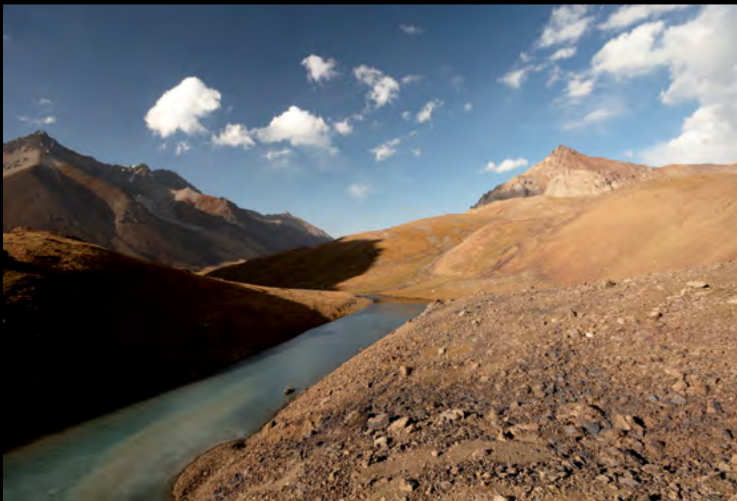
Jezera pod sedlem Kundýk

Do cílové vesnice přicházíme unavení a stavíme si stan kousek od ní. Někdy po půlnoci mě budí hlasité zvuky. Otevírám předsínku a mžourám nahoru na dva muže na koních. Chlapík s knírkem je trochu opilý a chce moji čelovku. Prý ji strašně potřebuje, že mu ji musím dát. Říkám, že mu ji nedám. Až po chvíli si všimnu, že má na zádech brokovnici.