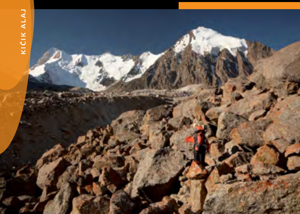
Průstup morénou k sedlu Skobeleva západní