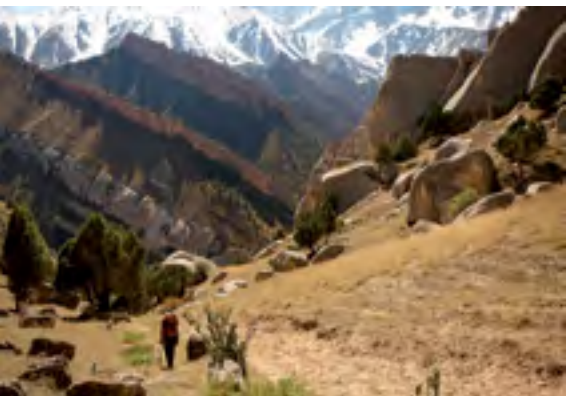
Vrstvení materiálu a spousta boulderů nad vesnicí Kodžakalant