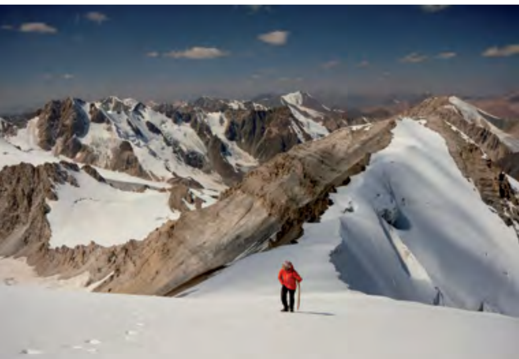
Vrcholový hřebínek na Čon Kumtor

narušují jen stopy orla. Po chvíli ho vidíme plachtit pod námi.