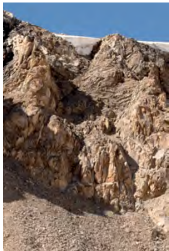
Crux cesty v sedle Skobeleva západní 4.750 m n. m., horší skálu jsem ještě neviděl