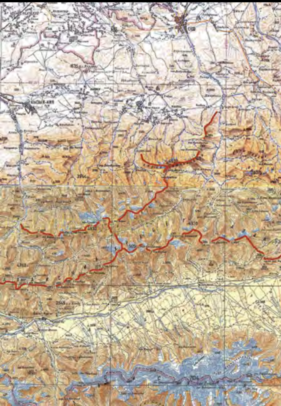
Nahore město Oš, uprostřed Kíčk Alaj, dole Pik Lenina