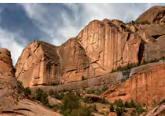
Oranžový pískovec svádí, ale bohužel není moc pevný