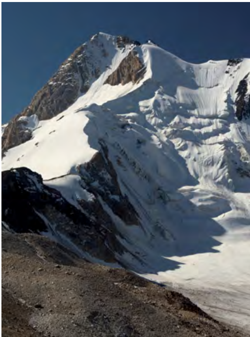
Pik 4.971 m n. m., vyzývavá hrana na rozhraní světla a stínu

Nejvyšší hora je Čon Kumtor, rusky Pik Skobeleva (5.051 m n. m.). V Kičik Alaji najdete desítky bezejmenných hor s výškou od 4.500 do 5.000 metrů.