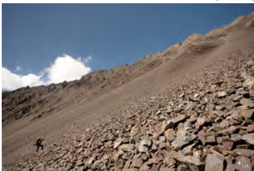
Sápání do sedla Kundyk

Čeká nás první den bez batohů, tak se těšíme. Stan máme na moréně pod Čon Kumtorem a čeká nás super dilema. Ne-